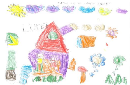
Luna Del Castillo Aguera

"Los niños no deben estar en la calle solitos, deben estar en las casas con los papás y estudiar"